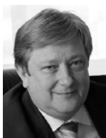
КОНСТАНТИН УГРЮМОВ Президент, Председатель Совета НП НАПФ