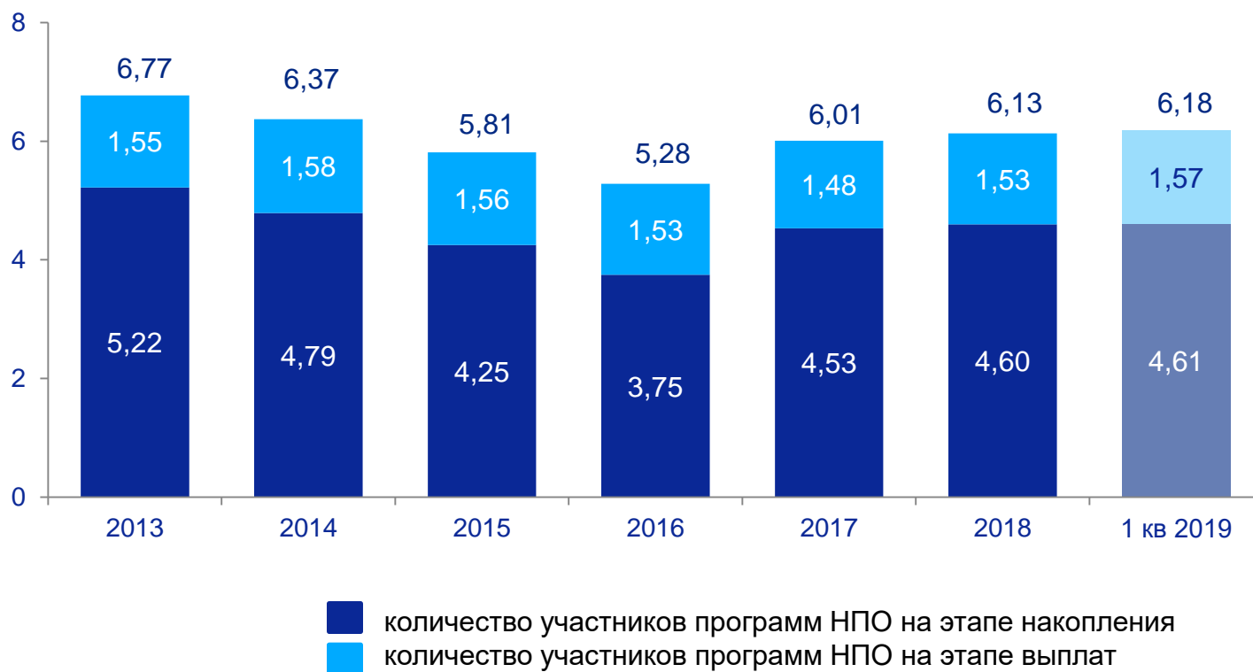
Количество участников программ НПО (млн. человек)